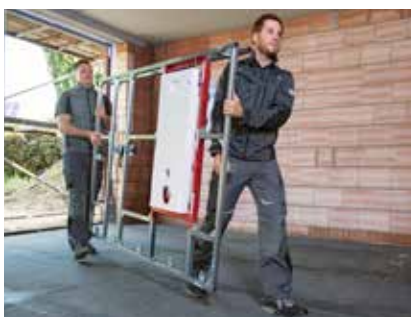
4. Anlieferung der fertigen Installationswand auf die Baustelle