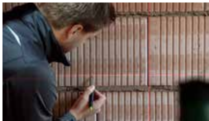
1. Aufmaß auf der Baustelle

In einer wirtschaftlichen Bewertung führt die Vorfertigung zu einer Reduzierung von Regiekosten und Wegzeiten und damit zu mehr Effizienz im Arbeitsalltag. Auch der Bauherr wird diese Montageart begrüßen, denn der Bauablauf auf der Baustelle wird optimiert – egal ob im Neubau oder in der Sanierung.