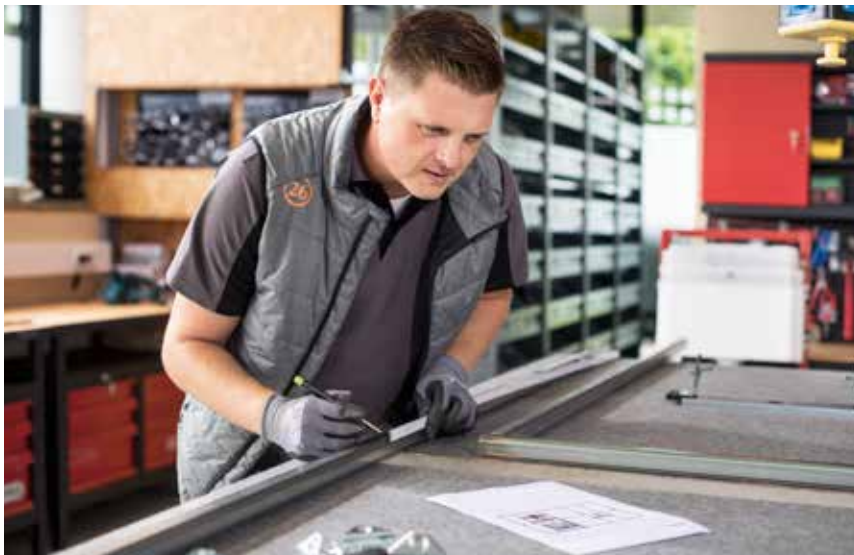
3. Vorfertigung in der Werkstatt