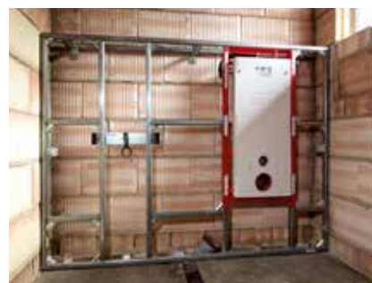
5. Montierte Vorwand, fertig zum Beplanken und Verfliesen.

Besuchen Sie uns auf unserer Website www.tece.com , oder legen Sie unter http://smartwall.tece.de direkt los!