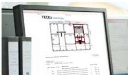
2. Planung mit TECEsmartwall